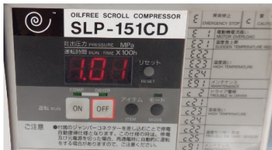
最高圧時表示(1.0MPa設定)